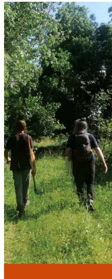
Arpentage citoyen Limoux

L'association Graines de Paysans réalise de la prospection foncière et des recherches de financements en coordination départementale afin d'aider de jeunes agriculteurs dans leur installation. Deux candidats en maraîchage pourront tester la viabilité de leur projet durant trois ans grâce à un partenariat avec MP2 Environnement et la mise à disposition de lieux-tests de culture.