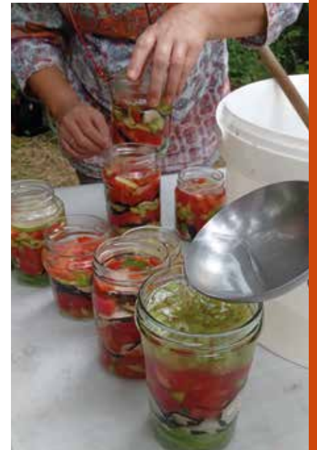
Atelier Manger Mieux Pour 3 Fois Rien - Lactofermentation