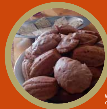
Madeleines aux cynorrhodons