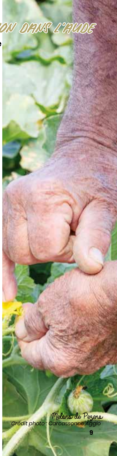
Melons de Pezens

Bien que diversifié et évoluant dans le "bon sens", notre régime alimentaire n'est pas pour autant optimal d'un point de vue nutritionnel, sanitaire et écologique. D'après le scénario Afterres 2050 réalisé par le bureau d'étude Solagro, il faudrait diviser par deux notre consommation de produits laitiers et de viande, réduire l'alcool et compenser par une augmentation conséquente de la part de céréales, légumineuses, fruits et légumes pour tendre vers un régime alimentaire soutenable pour l'homme et son environnement.