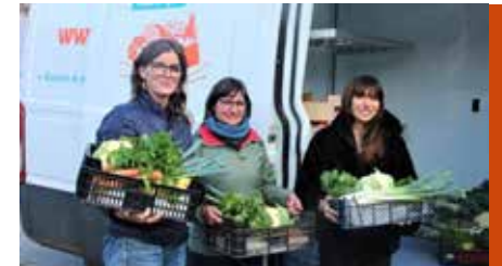
Panier CD11 MDS